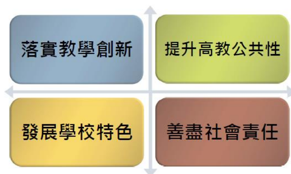
圖 5-5-2 高教深耕四大目標